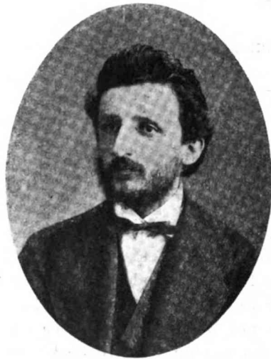
El profesor Pier Andrea Saccardo en la época en que conoció a Carlos Spegazzini (1873), a la sazón alumno del Colegio « Marco Foscarini » de Venecia.

Pocos son los hombres que como Pier Andrea Saccardo hayan demostrado de la mejor manera que nacemos con un rumbo definido;